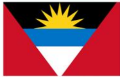
Antigua and Barbuda