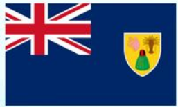
Turks and Caicos Islands