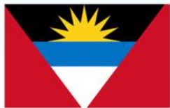
Antigua y Barbuda