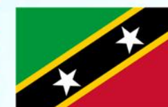
San Cristóbal y Nieves