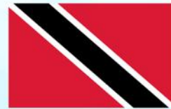
Trinidad and Tobago