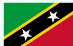
Saint Kitts and Nevis