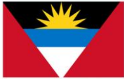
Antigua and Barbuda