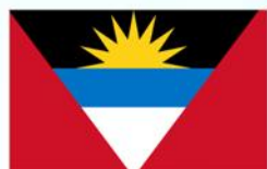
Antigua y Barbuda