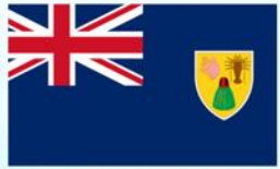
Turks and Caicos Islands