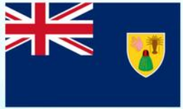
Turks and Caicos Islands