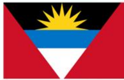
Antigua and Barbuda