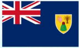
Turks and Caicos Islands