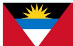
Antigua y Barbuda