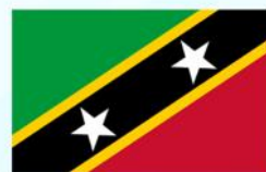
Saint Kitts and Nevis