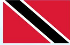
Trinidad and Tobago