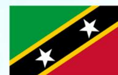
San Cristóbal y Nieves