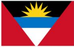
Antigua and Barbuda