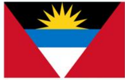
Antigua and Barbuda