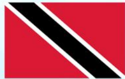
Trinidad and Tobago