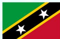
Saint Kitts and Nevis