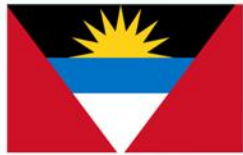
Antigua y Barbuda