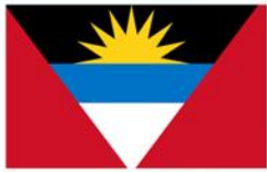
Antigua and Barbuda