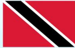
Trinidad and Tobago