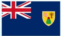
Turks and Caicos Islands