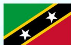
Saint Kitts and Nevis