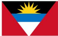
Antigua and Barbuda