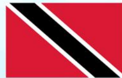
Trinidad and Tobago