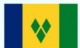
Saint Vincent and the Grenadines