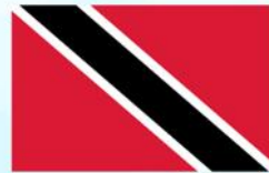
Trinidad and Tobago