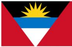
Antigua and Barbuda