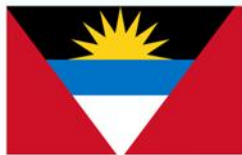
Antigua y Barbuda