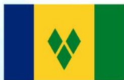
San Vicente y las Granadinas