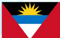
Antigua y Barbuda