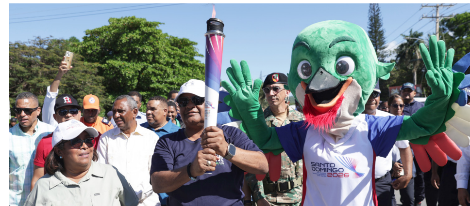
The torch relay in Barahona saw massive participation from all sectors of the population.