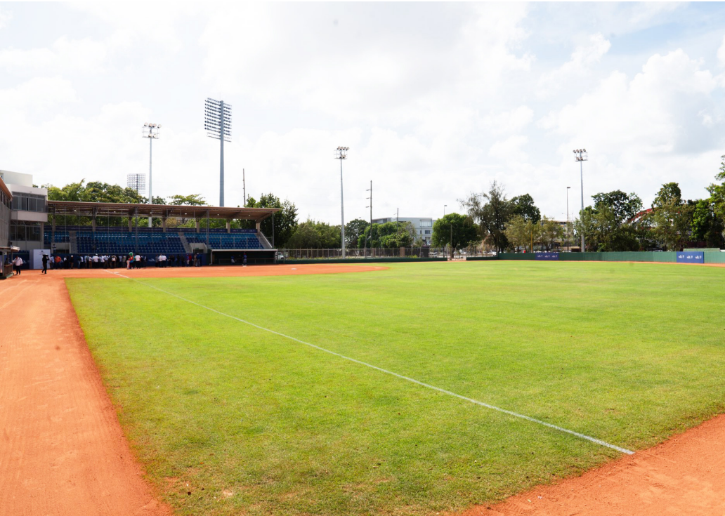
The field of the softball stadium A at the Olympic Center is in optimal condition.