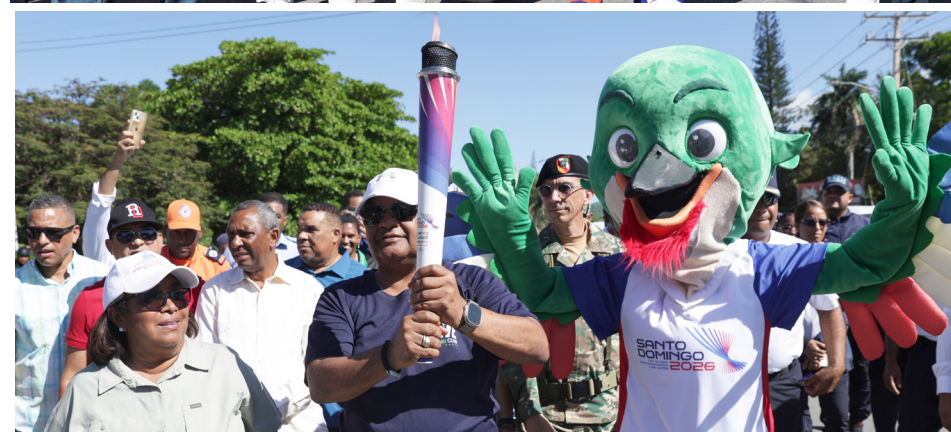
El recorrido de la llama, en Barahona, tuvo una masiva participación de todos los sectores de la población.