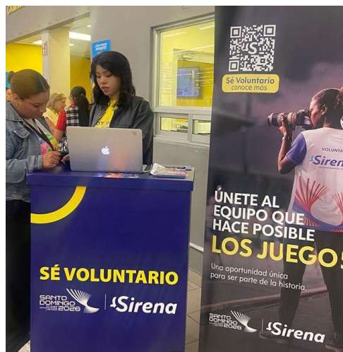
Empleadas de la Sirena, en Santiago, toma datos a aspirantes a voluntarios para colaborar con los Juegos.

Con estas palabras el destacado deportista recordó que la prioridad absoluta de la organización es garantizar el bienestar de los protagonistas de la justa, facilitando su estancia y competencia a través de un servicio eficiente.