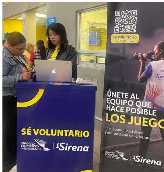
Employees of La Sirena, in Santiago, collect information from prospective volunteers for the Games.

With these words, the distinguished athlete reiterated that the organization's absolute priority is to guarantee the well-being of the participants in the Games, facilitating their stay and competition through efficient service. The aim was to raise awareness among