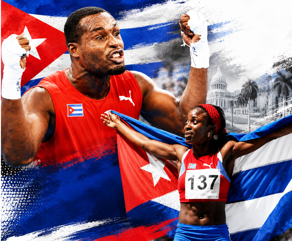
Julio César La Cruz and Rose Mary Almanza contributed gold medals to Cuba at the 2023 Central American and Caribbean Games in San Salvador, excelling in boxing and athletics, respectively.

Cuba's qualifying campaign for the XXV Central American and Caribbean Games has already surpassed 200 athletes in 19 disciplines.