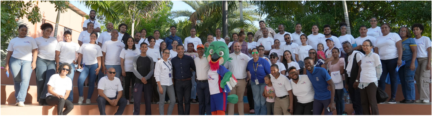
Personal de los Juegos Centroamericanos y del Caribe Santo Domingo 2026 junto a un grupo de aspirantes a voluntarios de Ciudad Juan Bosch.