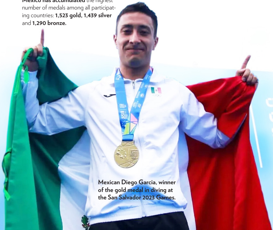
Mexican Diego Garcia, winner of the gold medal in diving at the San Salvador 2023 Games.

Mexico has accumulated the highest number of medals among all participating countries: 1,523 gold, 1,439 silver and 1,290 bronze.