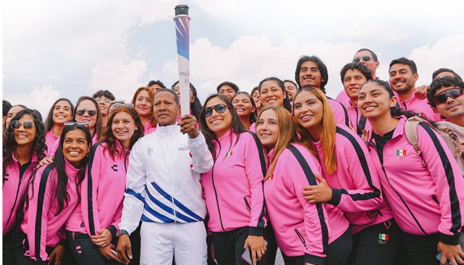
El medallista olímpico de taekwondo, Gabriel Mercedes, recibió la antorcha en México.

E l recorrido de la antorcha de los XXV Juegos Centroamericanos y del Caribe Santo Domingo 2026 iniciará este viernes 8 de mayo en la provincia de Pedernales, donde comenzará a transitar por todas las provincias de la región sur, marcando el comienzo de uno de los momentos más simbólicos de esta cita deportiva regional.