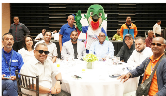
Parte de los cronistas que asistieron al encuentro en Santiago.