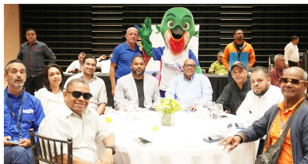
Some of the sportswriters who attended the meeting in Santiago.