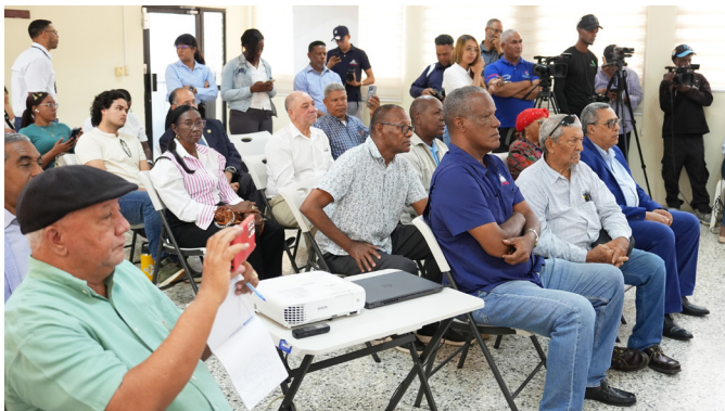
Some of the journalists attending the meeting held by the Organizing Committee.