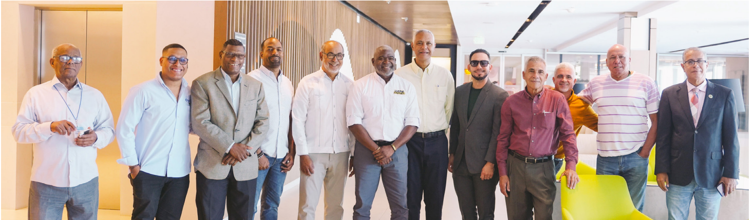
Prominent sports journalists from the Cibao region who attended the meeting convened by the Organizing Committee of the Santo Domingo 2026.