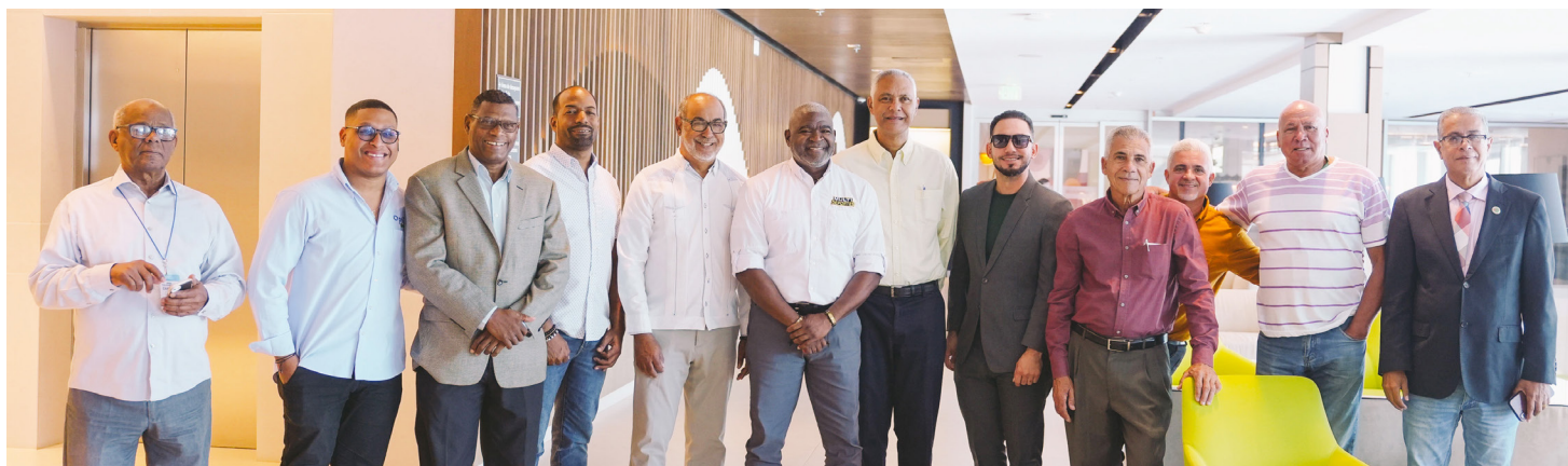
Destacados periodistas deportivos del Cibao, que asistieron al encuentro convocado por el Comité Organizador de los juegos JCC Santo Domingo 2026.