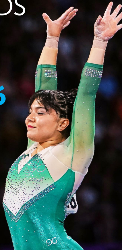
Alexa Moreno, from Mexico, winner of the gold medal in artistic gymnastics at the San Salvador 2023 Games.

M exico is emerging as one of the top contenders to win the centennial edition of the XXV Central American and Caribbean Games in Santo Domingo 2026. Mexico, winner of 13 of the 24 editions of the world's oldest multi-sport event, currently leads the list of qualified athletes, with 482 registered in 37 disciplines.