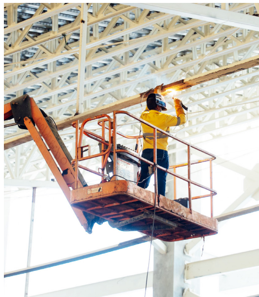
A worker is working in the Combat Pavilion.

“ The support received from President Abinader's government for these games will be the greatest support that Dominican sports and youth will ever receive. ”