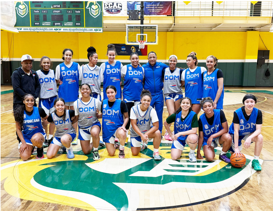
Women's team participating in the evaluation and training camp in New York