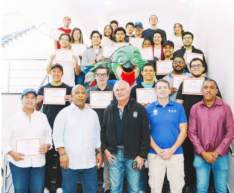
Participantes en el curso de squash organizado por la Dirección Técnica del Comité Organizador de SD 2026.

E l deporte del squash será una de las novedades que se estrenará en los XXV Juegos Centroamericanos y del Caribe Santo Domingo 2026.