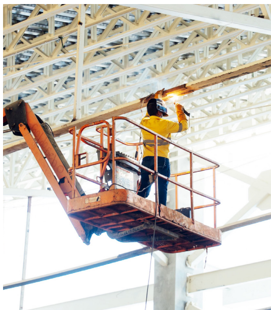
Obrero trabaja en el Pabellón de Combate.

“ El apoyo recibido del Gobierno del presidente Abinader en favor de estos juegos, los cuales serán el mayor respaldo que recibirán el deporte y la juventud dominicana. ”