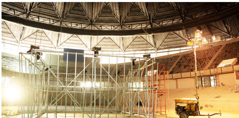
Aspecto de los trabajos que se realizan en el Palacio de los Deportes Virgilio Travieso Soto.