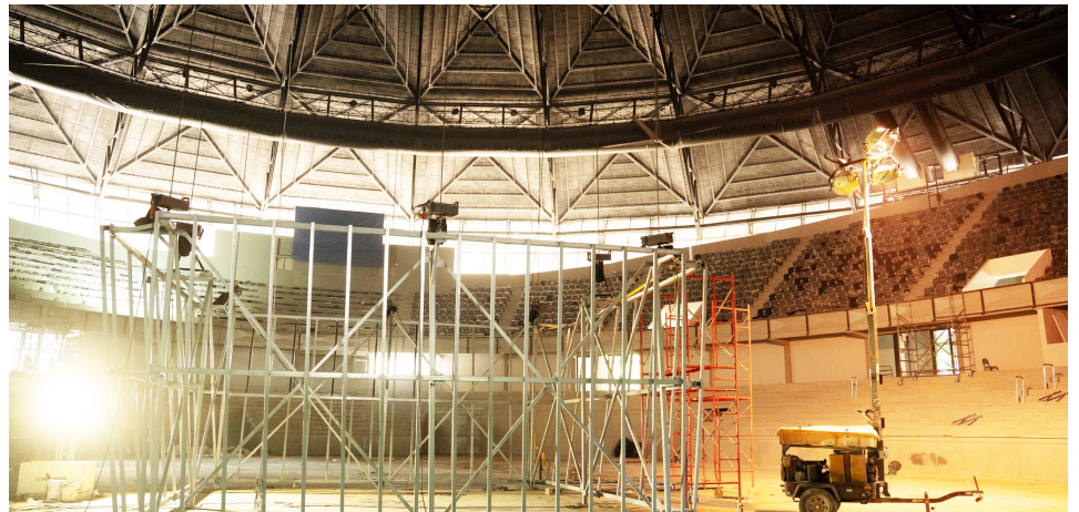
A view of the work being carried out at the Virgilio Travieso Soto Sports Palace.