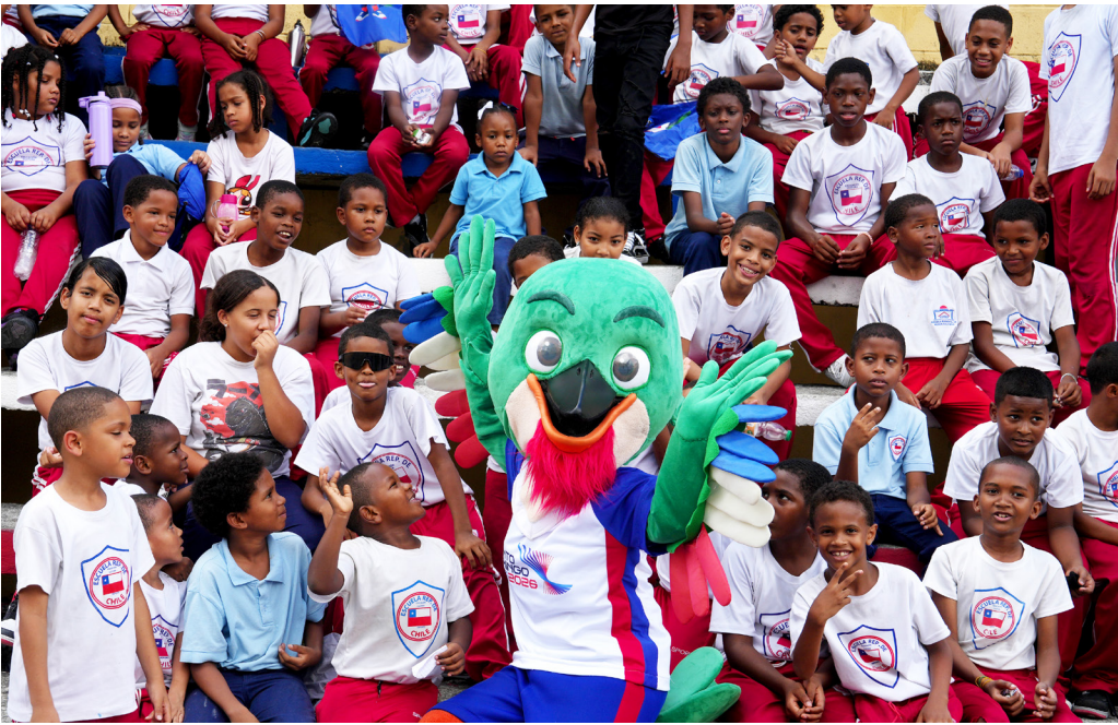
Colí está llevando el mensaje de los Juegos Santo Domingo 2026 a todos los rincones del país.