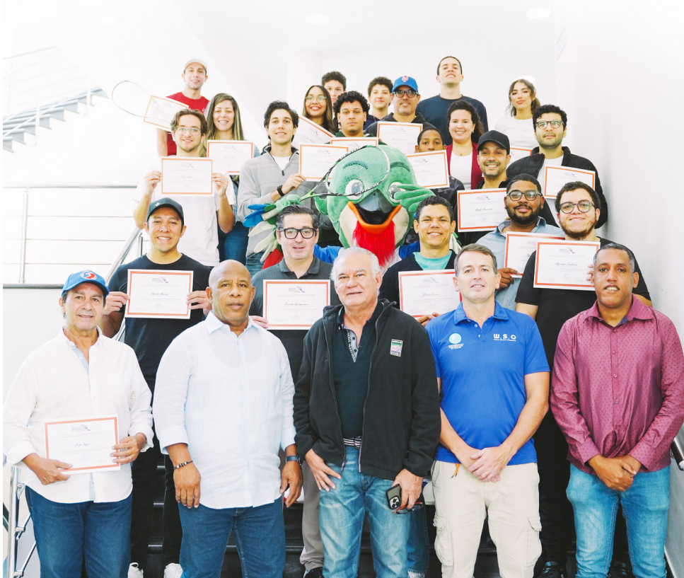
Participants in the squash course organized by the Technical Directorate of the SD 2026 Organizing Committee.