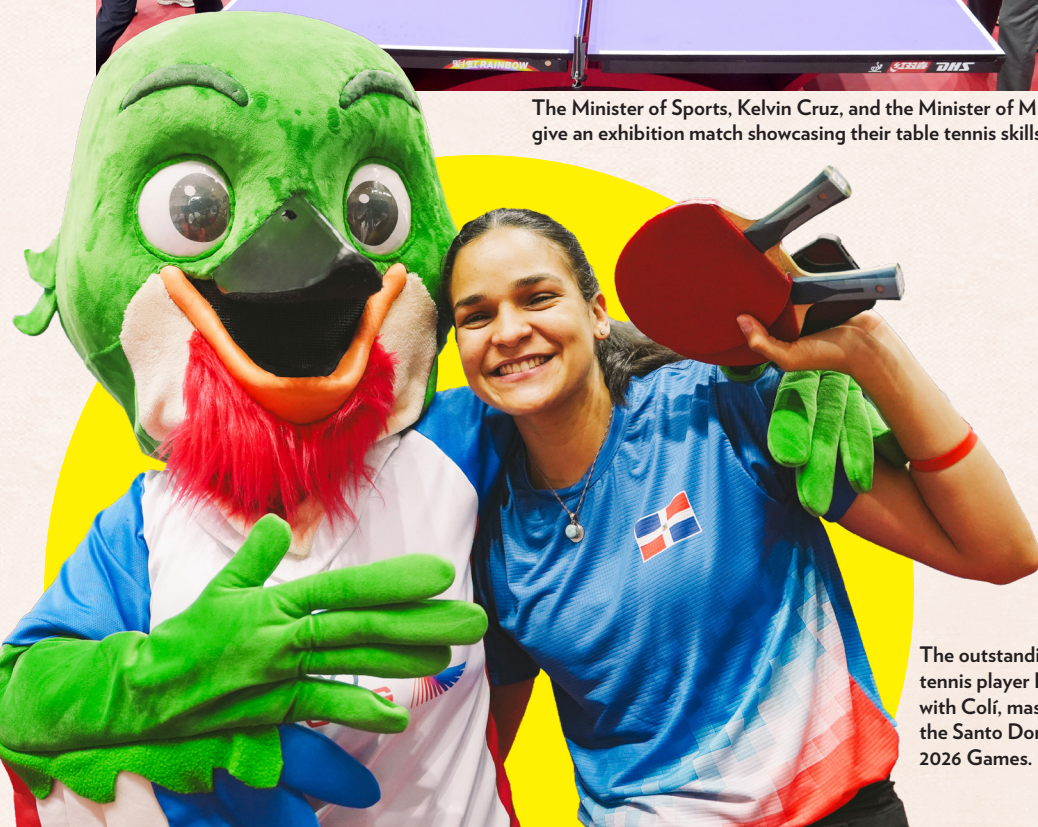
The outstanding table tennis player Eva Brito with Colí, mascot of the Santo Domingo 2026 Games.