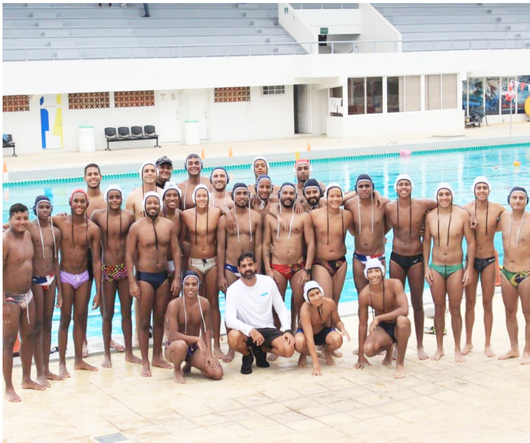
Members of the national water polo pre-selection team.