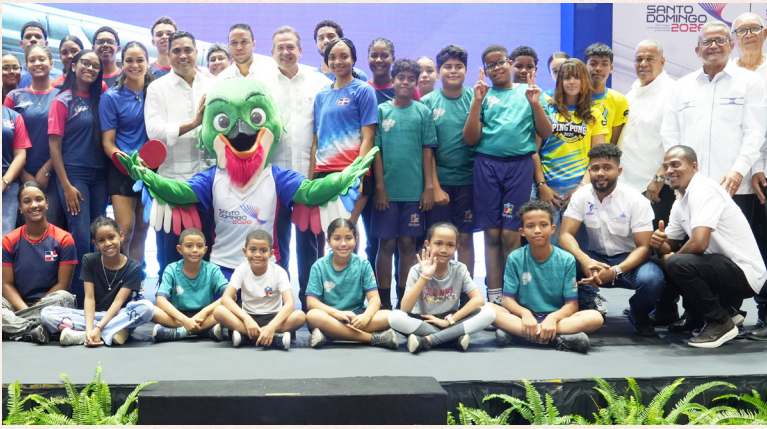
Autoridades se confunden con la mascota Colí, y un numeroso grupo de tenistas.