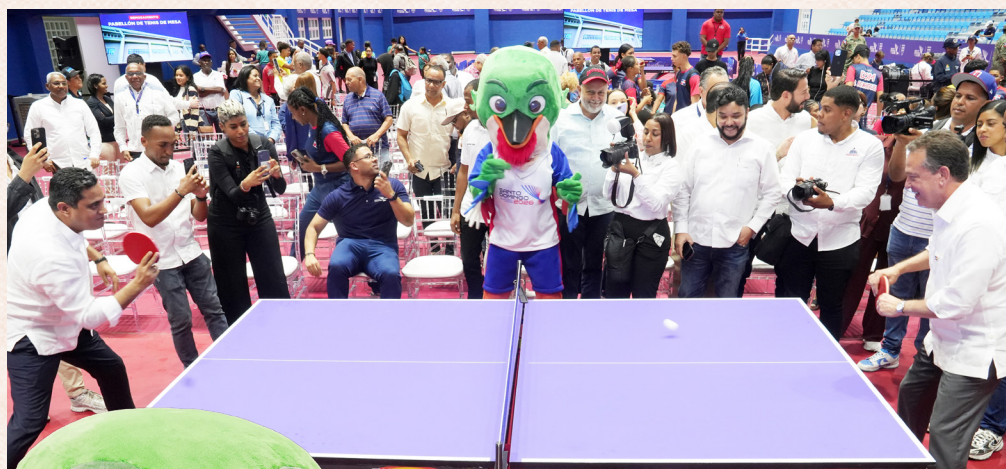
El ministro de Deportes, Kelvin Cruz y el de MIHVED realizan una exhibición, sobre sus cualidades tenimesísticas