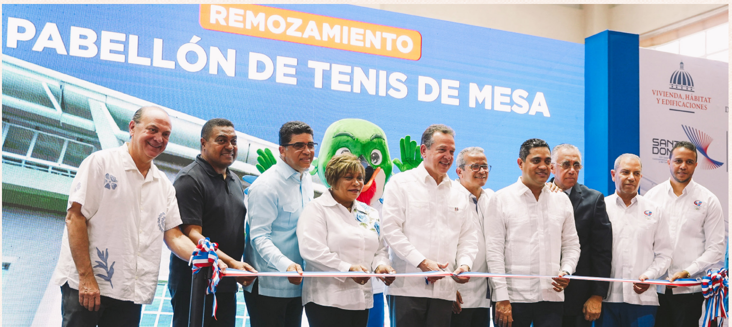
The Minister of MIVHED, Víctor Bisonó, cuts the ribbon to inaugurate the renovated Table Tennis Pavilion in Parque del Este. He is accompanied by government officials, directors of the SD2026 Organizing Committee, sports leaders, and special guests.