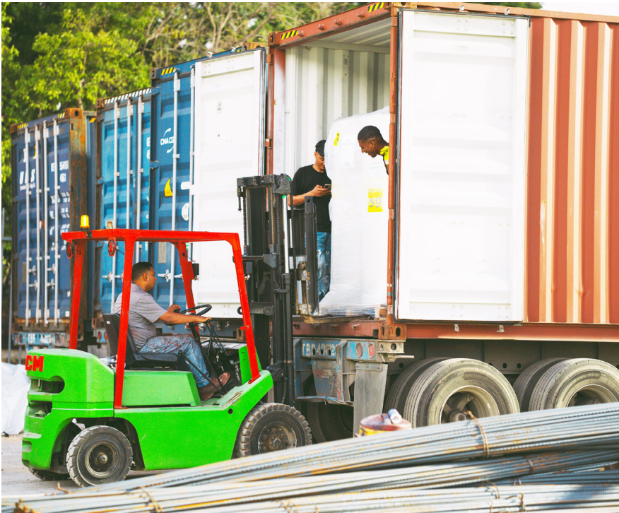
Obreros descargan el material sintético de las dos pistas de atletismo del Estadio Félix Sánchez.