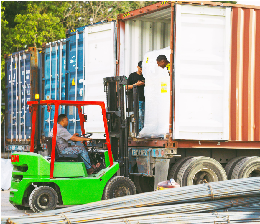
Workers unload the synthetic material for the two athletic tracks at the Félix Sánchez Stadium.