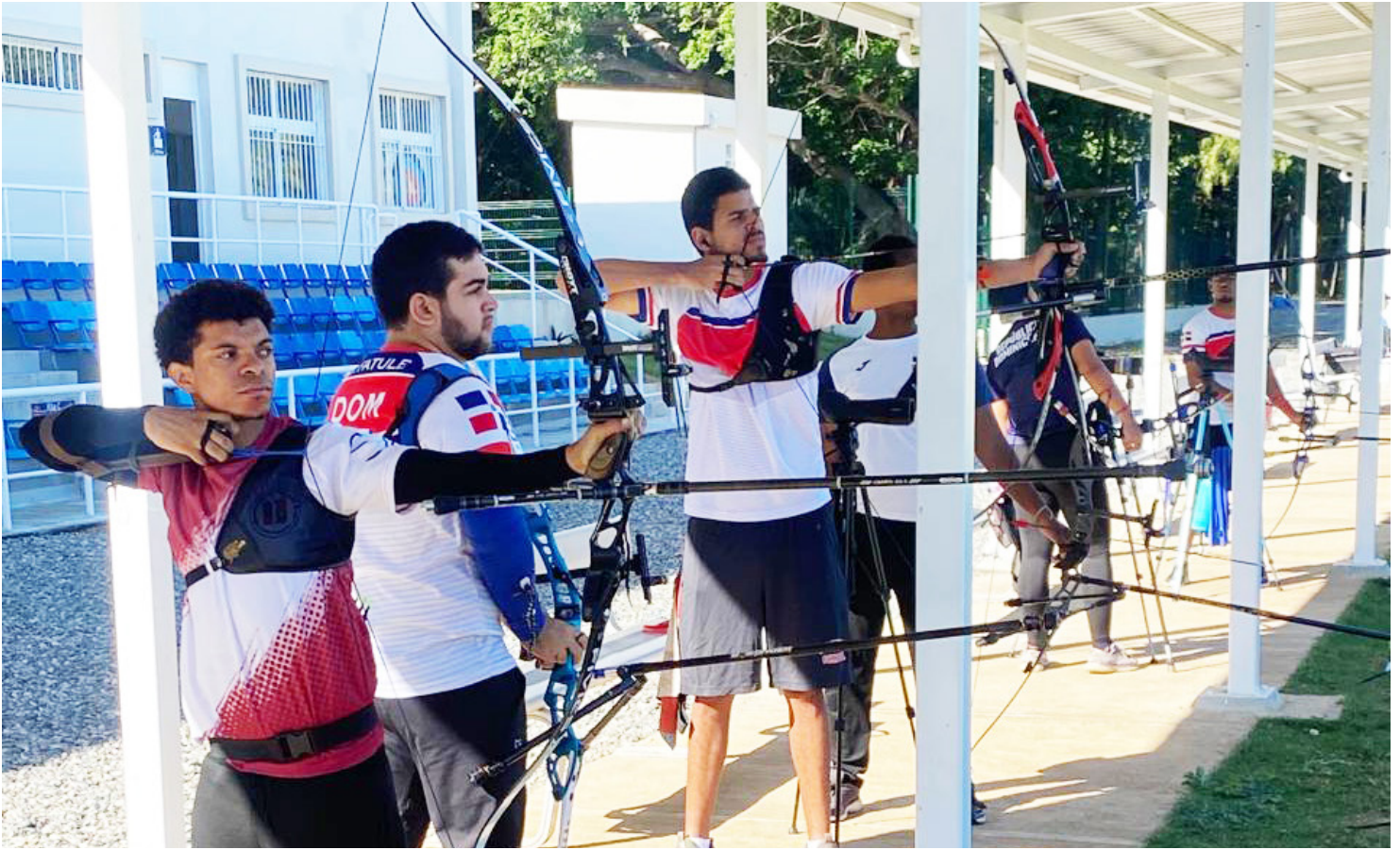
A group of archers' train at the renovated facilities for the Santo Domingo 2026 Central American and Caribbean Games.

In 2003, for the XIV Pan American Games, a modest archery range was built in the Parque del Este complex. Today, it has been transformed into a large facility with a welcoming atmosphere.