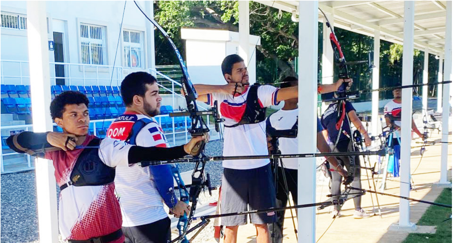
Grupo de arqueros entrenan en las instalaciones remozadas para la realización de los Juegos Centroamericanos y del Caribe Santo Domingo 2026.

Para el año 2003 y en ocasión de los XIV Juegos Panamericanos fue construida una modesta cancha de arquería en el complejo Parque del Este, la que hoy ha sido transformada en una gran instalación que muestra un panorama acogedor.