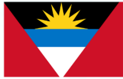
Antigua and Barbuda