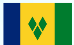
Saint Vincent and the Grenadines