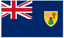
Turks and Caicos Islands