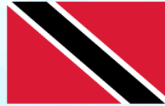
Trinidad and Tobago