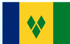
San Vicente y las Granadinas