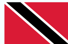
Trinidad y Tobago