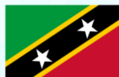
Saint Kitts and Nevis